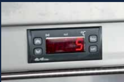
Kühlregler/Kühlanzeige zur Steuerung der Kompressorkühlung

Système de batteries affichage du niveau de charge sur un écran d'information