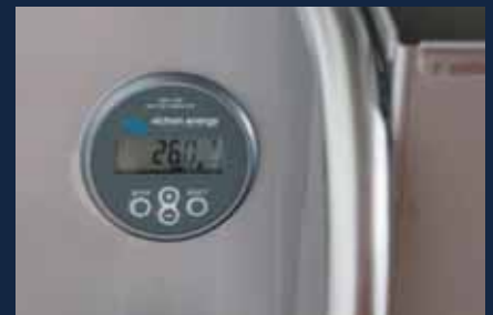
Akkusystem Anzeige der Ladestände auf einem Infodisplay

Panneau de contrôle de l'entraînement avec interrupteur d'arrêt d'urgence