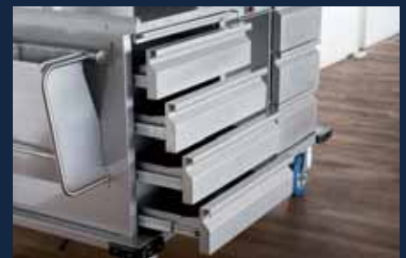
4 Geschirr-Schubladen zur Aufnahme von Geschirrkörben 500 x 500 mm

3 tiroirs GN dont 2 réfrigérés pour la mise en place de GN 1/1 - 150 mm