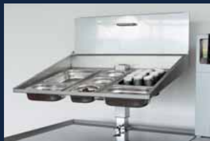
Zutenaufsatz Zubehör direkt Griffbereit in GN-Behältern

Fonctionnement autonome pour des appareils avec 3000 W et 230 V max.