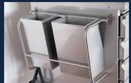
Abfallbehälter zur Trennung von Bio- und Restmüll

Compartiment pour ingrédients accessoires à portée de main dans des récipients GN