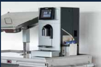
Autarker Gerätebetrieb für Geräte mit max. 3000 W und 230 V

4 tiroirs à vaisselle pour la mise en place de paniers à vaisselle 500 x 500 mm