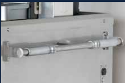
Sensorgesteuerter Antrieb für einfaches manövrieren ohne Kraftaufwand

Moteur contrôlé par capteur pour manœuvrer sans effort