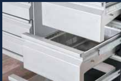
3 GN-Schubladen, davon 2 gekühlt zur Aufnahme von GN 1/1 - 150 mm

Régulateur/affichage de la réfrigération pour la réfrigération par compression